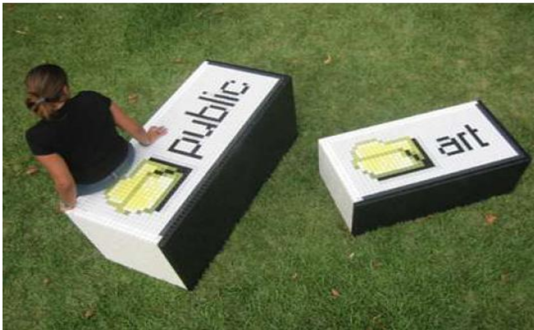
Xavi Muñoz. "PUBLIC ART" Instalación urbana. Técnica mixta:madera, pintura, mosaico vítreo, esmalte. Medidas variables. (PUBLIC: 70 x 145 x 58 cms/ ART: 44 x 104 x 58 cms) Barcelona 2003.